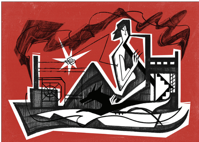
Katya Grineva, «Image symbolique de la ville industrielle de Marioupol, détruite par les bombes», 2022, technique mixte, Lviv.

Sans rancune et en amitiés, soyons solidaires de toutes et tous les opprimé·es et exploité·es du monde; et, dans le cas présent, des peuples ukrainien, russe et biélorusse, sous l'agression pour l'un de l'armée aux ordres de Poutine et sous le pouvoir de dictateurs pour les autres. Notre anticapitalisme commun ne peut pas faire l'économie de ce soutien sans pour autant nous amener à défendre le « monde libre », comme on disait à l'époque de la guerre froide!